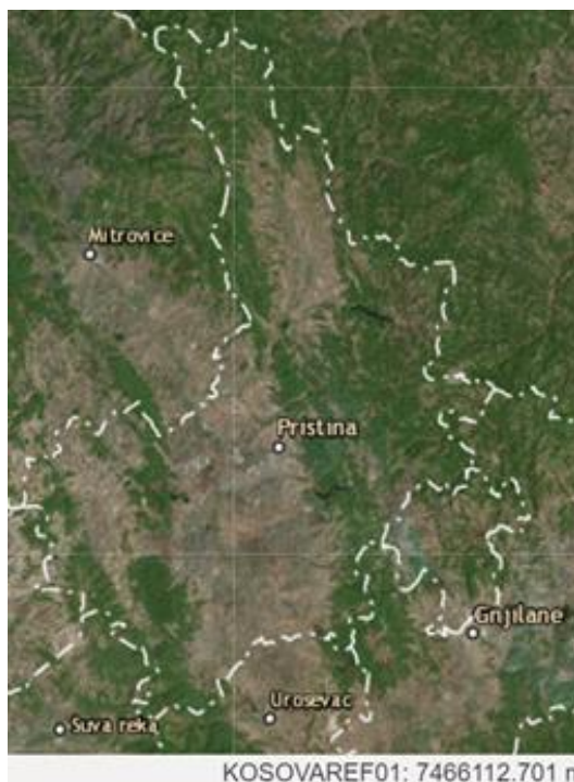
Figura 1. Harta Satelitore e Terrenit të Rajonit Ekonomik Qendër 8

Rajoni Ekonomik Qendër karakterizohet nga peizazhi mbizotërues kodrinor me fusha të vogla në mes të terrenit malor që mbulon shumicën e territorit të rajonit. Një panoramë e tillë siguron potencial të rëndësishëm zhvillimi si në kuptimin e shfrytëzimit të burimeve natyrore në dispozicion (p.sh. Drurit), por edhe për një sërë aktivitete në fushën e turizmit rural dhe alpin. Toka është një resurs i rëndësishëm zhvillimi, i cili vazhdimisht po zvogëlohet në Rajonin Ekonomik Qendër dhe në të gjithë vendin.